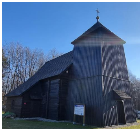
Fotografia 4. Widok na kościół pw. Św. Bartłomieja w Smolnicy.

Kościół zbudowany w latach 1776-1777, XVIII w., odnawiany w latach 1905-1906 oraz 1937-1938. Kościół jest świątynią salową, na rzucie prostokąta, z węższą od nawy, trójboczną apsydą, umiejscowioną po stronie wschodniej. Nawa nakryta jest dachem dwuspadowym, nad apsydą znajduje się dach trójspadowy. Od strony północnej usytuowana została