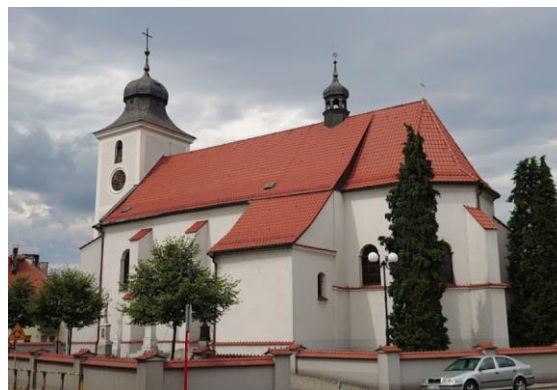
Fotografia 6. Widok na kościół pw. Św. Jakuba w Sośnicowicach.

Kościół św. Jakuba Starszego w Sośnicowicach to budowla pochodząca z połowy XIV wieku, która w wyniku późniejszych przebudów uzyskała w dużym stopniu charakter barokowy. W latach 1555-1679 ten parafialny kościół przejęty został przez protestantów, sprowadzonych na te tereny i popieranym przez ówczesnych właścicieli Sośnicowic, panów Trach von Brzezic. Potem kościół św. Jakuba Starszego powrócił do rąk katolików. W 1780 roku świątynia strawiona została przez pożar. W latach 1786-94 nastąpiła odbudowa, dokonana z inicjatywy hrabiego