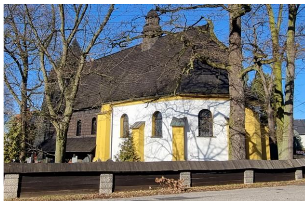
Fotografia 5. Widok na kościół pw. Trójcy Świętej w Rachowicach.

Kościół orientowany, otoczony cmentarzem. Nawa kościoła drewniana, o konstrukcji zrębowej, otoczona sobotami wspartymi na słupach z zastrzałami, po stronie północnej soboty oszalowane, od północy pokryta gliną i pobielona, od południa obita gontem. Nawa na rzucie zbliżonym do kwadratu, od wschodu przylega do niej węższe prezbiterium zamknięte 3-bocznie, oszarpowane. Prezbiterium i zakrystia murowane z cegły, otynkowane. Przy prezbiterium od strony północnej znajduje się 5-boczna zakrystia. Dach wspólny dla nawy i prezbiterium, 2-spadowy, pokryty gontem. Na wieży wysoki dach namiotowy, 8-boczny, gontowy. Nad prezbiterium 6-boczna wieżyczka na sygnaturkę zwieńczona gontową kopułką. Elewacje pobite gontem. Na zewnętrznej ścianie prezbiterium znajduje się żeliwna płyta nagrobna Franciszka Imieli (odlew Huty Gliwickiej). Wieża drewniana o konstrukcji słupowej, przylegająca do nawy od strony zachodniej, w jej przyziemiu znajduje się kruchta wejściowa.