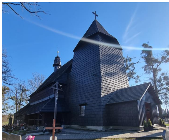
Fotografia 3. Widok na Kościół parafialny pw. Św. Katarzyny Aleksandryjskiej w Sierakowicach.