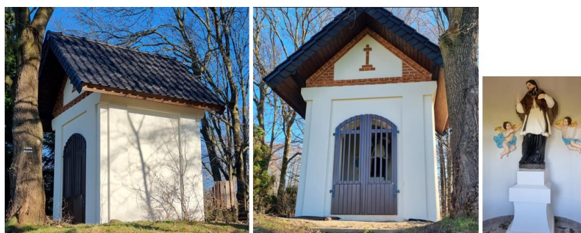
Fotografia 7. Widok na kapliczkę św. Jana Nepomucena w Łanach Wielkich.

Kapliczka jest objęta ochroną poprzez wpis do rejestru zabytków. W ostatnich latach przeprowadzono renowację kapliczki. Stan techniczny – bardzo dobry.