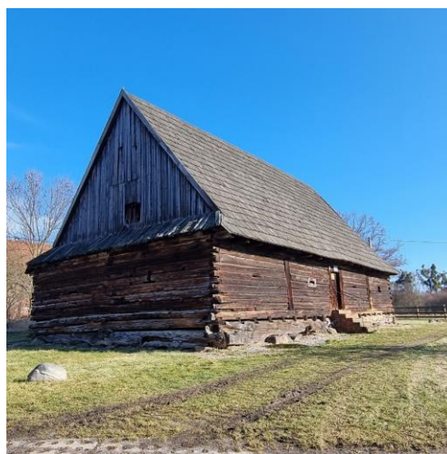
Fotografia 8. Widok na spichlerz drewniany w Rachowicach.

Jest to obiekt wolnostojący, drewniany, wzniesiony w konstrukcji mieszanej, tj. sumikowo-łątkowej w ścianach podłużnych oraz zrębowej w ścianach szczytowych, z podwaliną na peckach. Charakteryzuje się typową, prostopadłościenną, jednopiętrową bryłą zwieńczoną wysokim, krytym gontem dachem