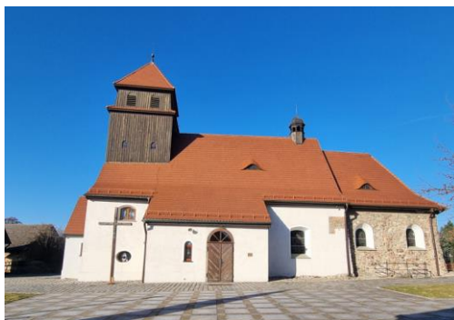
Fotografia 2. Widok na kościół pw. Św. Mikołaja w Kozłowie.