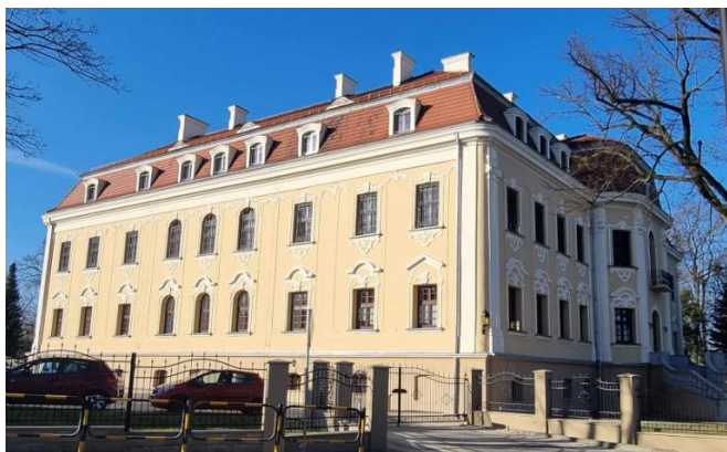
Fotografia 1. Widok na pałac w Sośnicowicach.

Budynek późnobarokowy, z dekoracją w stylu regencji i wczesnego rokoka. Wzniesiony na rzucie litery C, dwukondygnacyjny, wysoko podpiwniczony nakryty mansardowymi dachami z rzędami lukarni. Na osi elewacji frontowej korpusu prostokątny ryzalit o zaoblonych narożach, poprzedzony tarasem z dwoma przeciwległymi biegami wachlarzowych schodów - całość ujęta balustradą z murowanych tralek. Elewacje rozczłonkowane pilastrami jońskimi w porządku wielkim, z podziałami ramowymi i płycinowymi. podziałami ramowymi. W elewacjach frontowych partia piwnic wydzielona wyładowanym gzymsem cokołowym. Otwory okienne – prostokątne i zamknięte łukiem koszowym ramowane ornamentem regencyjnym rozbudowanym w nadprożach, na parterze zwieńczonych łukowymi odcinkami gzymsu. W dekoracji motywy listew, konsoli, muszli i kampanulli. Na cokole jednego z pilastrów od strony dziedzińca kamienna tablica z nazwiskami budowniczych Andres Stephan i Andres Wagner, 1755 r. W wnętrzu: sala balowa o zaoblonych narożach – w ryzalicie frontowym, w skrzydle wsch. – dawna prostokątna kaplica z prostokątną apsydą od wsch., z profilowanym gzymsem i polichromią. W skrzydle zach. dawna latryna.